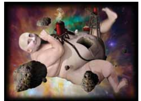
Et eksempel på det spilunivers vinderne fra TBWA har konstrueret. Her er vi på fedtplaneten.

KFI's Erhvervsdrivende Fond finansierer hjemmesiden, og Nordea-fonden finansierer voksenmateriale.