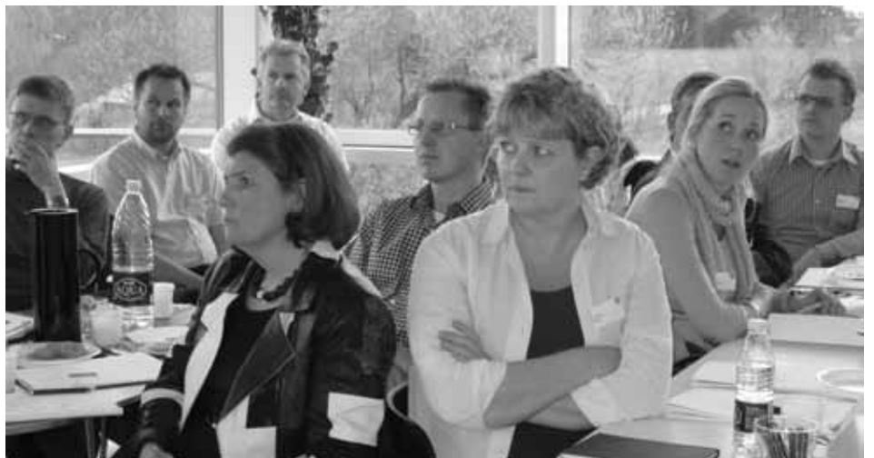
Seminarerne i Roskilde (øverst) og Silkeborg (nederst) trak mange deltagere.

"Vi har endnu ingen tilbagetrækninger, hvor Dansk Varefakta Nævn har været involveret. Det synes jeg lige, jeg burde nævne hér."